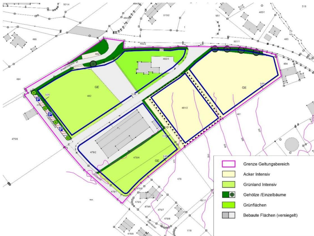
Abbildung 2: Bestand (unmaßstäblich)

Die Lebensraumfunktion gehen durch die Bebauung weitgehend verloren. Es bestehen mittlere bis hohe Auswirkungen.