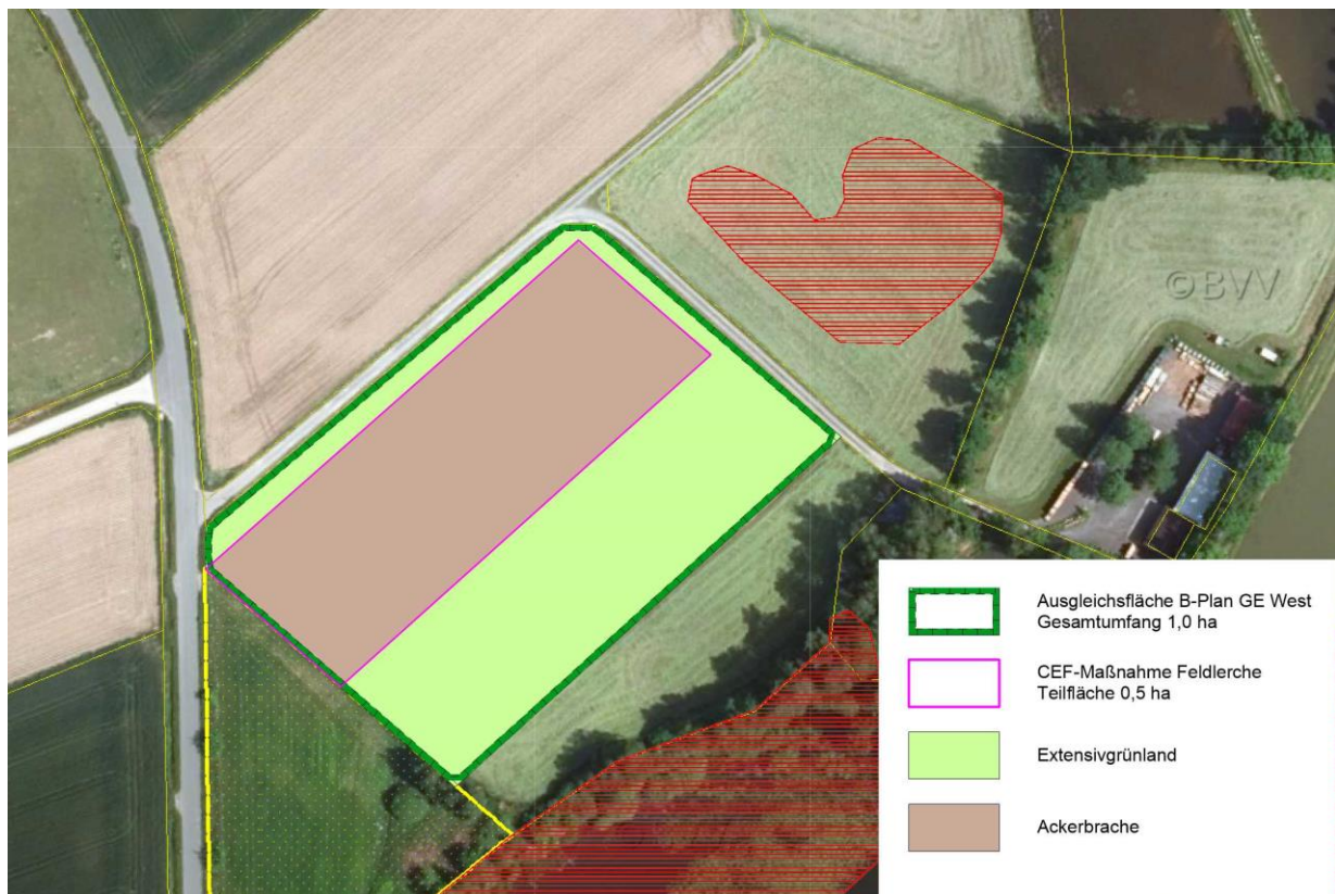
Abbildung 4: Maßnahmen (unmaßstäblich, rote Schraffur: Biotopflächen)

Die Maßnahmenfläche erfüllt nicht vollständig die vom LFU vorgegebenen Abstandskriterien zu vertikalen Gehölzstrukturen (100 m), weswegen von der Unteren Naturschutzbehörde Bedenken geäußert wurden.. Der Abstand der festgesetzten Ackerbrache zum Gehölzsaum am Herzigweiher liegt zwischen 60 m und 95 m. Die Fläche steht für eine Maßnahmenumsetzung zur Verfügung. Im Gemeindegebiet sind derzeit keine weiteren Flächen verfügbar, welche die Abstandskriterien erfüllen würden. Die Landschaft ist hier auch vorwiegend kleinteiliger strukturiert. Auch im Naturraum ist es aufgrund des gestiegenen Bedarfs an Kompensationsflächen für Bodenbrüter geeignete Flächen zu erwerben. Darüber hinaus werden beim betroffenen Feldlerchenbrutpaar im Plangebiet die angenommenen Abstände zu vertikalen Strukturen unterschritten.